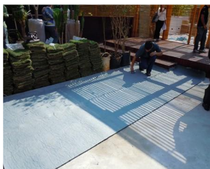
2. Aplicação da manta geodrenante e/ou bidim