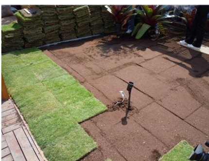
5. Plantio da vegetação convencional.