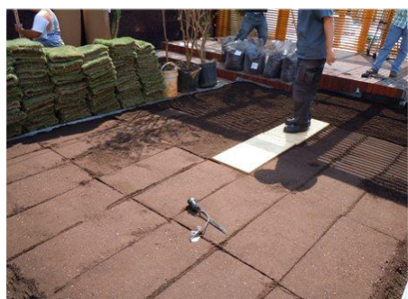
5. Aplicação do substrato em camada na espessura desejada