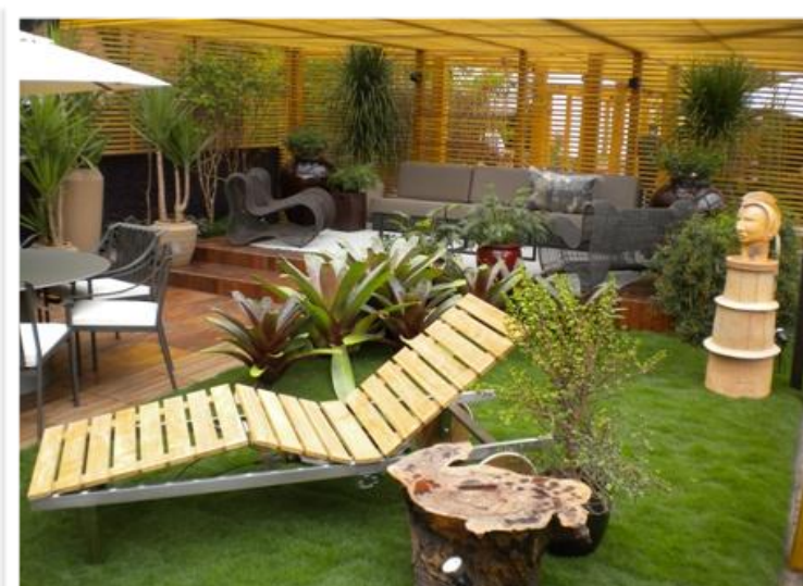
7. Aparência após 30 dias de enraizamento.