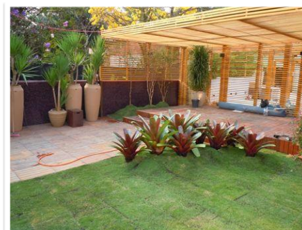
6. Aparência imediata pós-plantio.