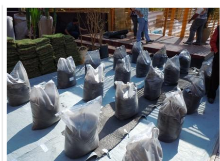
2. Posicionamento das embalagens de substrato