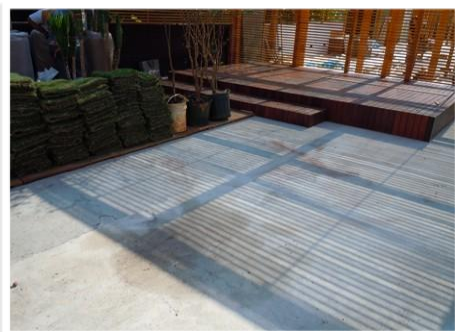
1. Laje impermeabilizada pré-existente